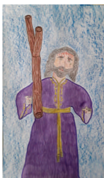
RAFAEL FDEZ. RODRÍGUEZ